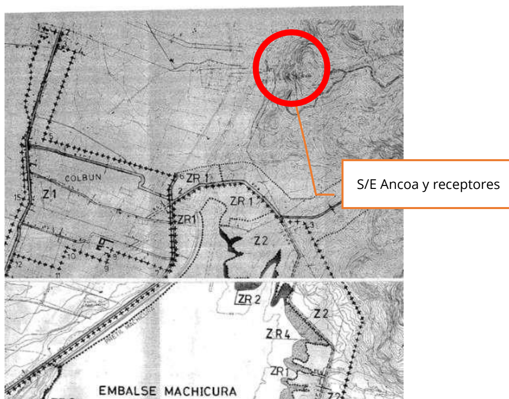
Figura 3. Plano regulador Colbún, Maule.

A continuación, se presenta el plano regulador de la comuna de Colbún.