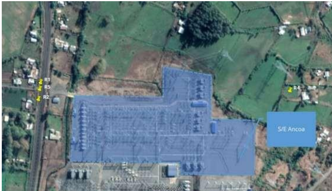
Figura 5. Emplazamientos de los receptores sensibles al proyecto.

En este apartado se presentan los receptores considerados en el estudio.