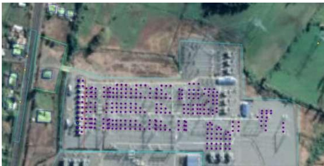
Figura 4. Vista en planta de la simulación del proyecto en SoundPlan 8.0.